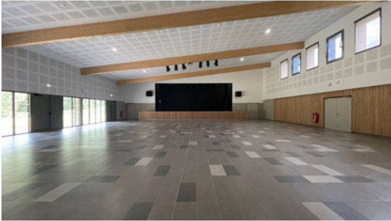
Vue d'ensemble de la salle